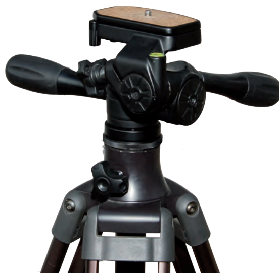
Der Fluid-Neigekopf mit Schnellwechselplatte und den speziell angeordneten Griffen.

Mit der Schnellwechselplatte mit 1/4-Zoll-Fotogewinde können Sie auch schweres Zubehör bequem erst auf der Platte montieren, um es dann nur noch auf das Stativ zu klipsen. Der Klemmhebel hält die Schnellwechselplatte sicher in ihrer Position. Zum Schutz gegen unbeabsichtigtes Betätigen des Hebels dient der kleine, silberne Sicherungshebel. Wenn Sie ihn umlegen, kann die Platte nicht mehr versehentlich gelöst werden.